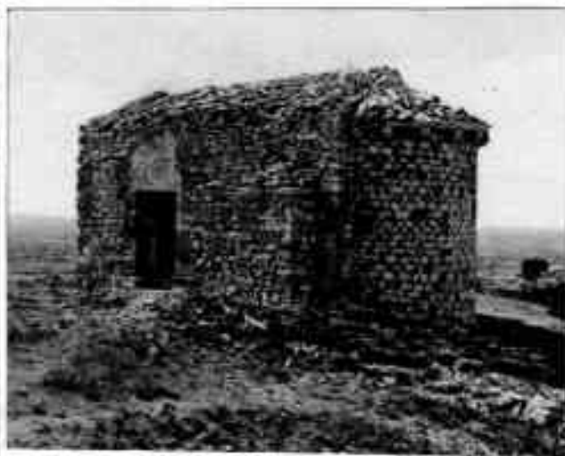
CHAPELLE ST PIERRE AU DEBUT DU SIECLE