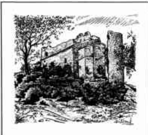
Dessin de Roger TAILLADE qui nous a quittés précipitamment l'automne dernier Dessin reproduit avec l'aimable autorisation de Mme Taillade

A côté de l'aspect archéologique, il y aura aussi des travaux de maçonnerie: réfection de l'encadrement de la porte sud-ouest en pierre de taille, linteau et seuil de la porte nord, rejointoiement du parement extérieur du mur sud, rejointoiement des dalles du toit de l'église et rejointoiement des claveaux de la troisième travée de la voûte.