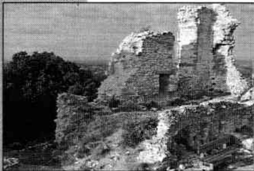
LA SALLE SUD AVANT TRAVAUX

Les murs de la salle sud seront rejointoyés lors du prochain chantier, mais les parties les plus abîmées ont été consolidées en urgence dès cette année.