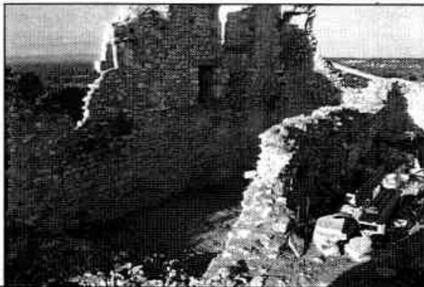
LA SALLE SUD APRES DEBLAIEMENT

Les murs de la salle sud seront rejointoyés lors du prochain chantier, mais les parties les plus abîmées ont été consolidées en urgence dès cette année.