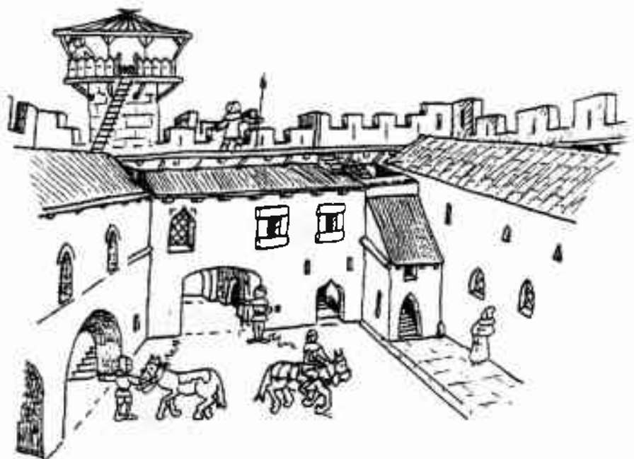
L'intérieur du château (la cour) vu par Roger Taillade avant même que nous ayons découvert l'escalier dans l'angle.