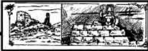
Dessin de R. TAILLADE